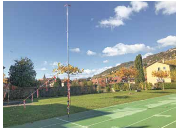
Les travaux vont pouvoir commencer sur le terrain de la Bourgette. | R. Brousoz