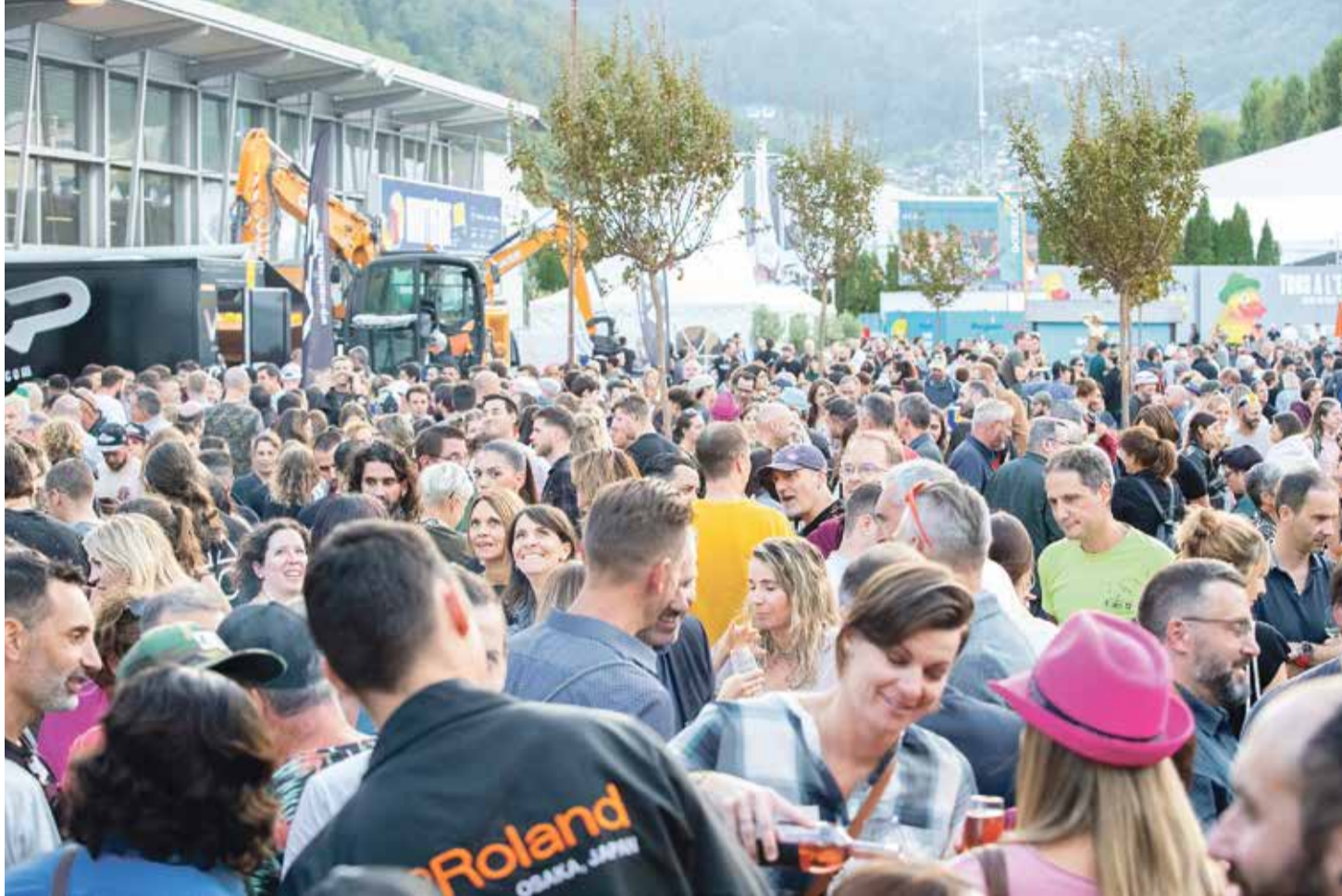
La Foire a drainé 248'000 visiteurs l'an passé.