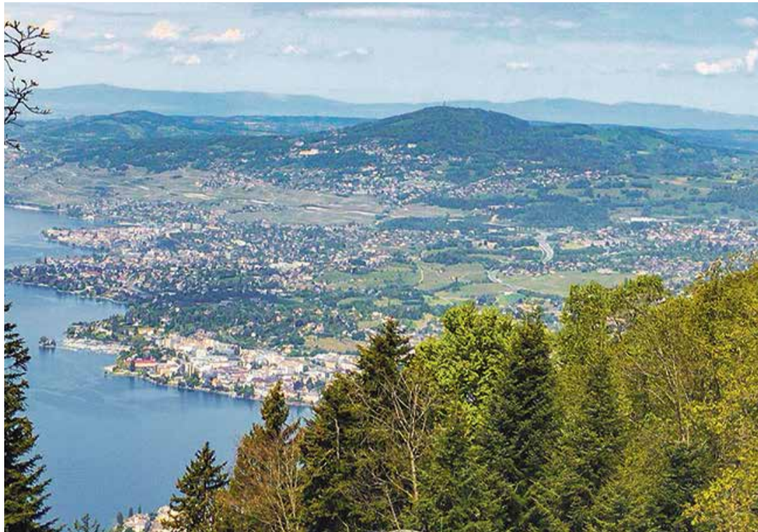
La Riviera forme avec une partie du Haut-Lac et de la Basse-Veveyse le périmètre de l'agglomération.

Berne a maillé son territoire en le découpant et en créant des zones pouvant contenir plusieurs cantons. C'est donc le cas de Rivelac qui englobe trois districts entre