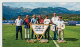
Crans Montana Football Camps