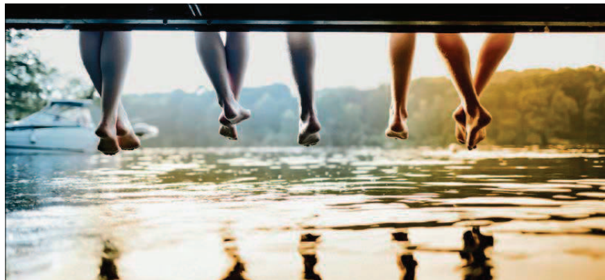
Als Gegenbewegung zu Overtourism boomt der Slow Tourism. Über Sinn und Unsinn eines Phänomens: ab Seite 15.